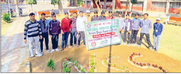
नारनौल। एनएसएस कैम्प में भाग लेते स्वयंसेवक।

बाबा खेतानाथ गवर्नमेंट पॉलिटेक्निक में राष्ट्रीय सेवा योजनाके सात दिवसीय विशेष शिविर के छठे दिन रविवार को योग गतिविधि, क्रिकेट मैच एवं पौधरोपण अभियान का आयोजन किया गया। इस अवसर पर विद्यार्थियों में शारीरिक स्वास्थ्य, खेल भावना तथा पर्यावरण संरक्षण के प्रति जागरूकता का संदेश दिया गया। कार्यक्रम की शुरुआत प्रातः योग गतिविधि से हुई। योग अभ्यास के दौरान विभिन्न आसन एवं प्राणायाम के माध्यम से मानसिक शांति, एकाग्रता और शारीरिक सुदृढ़ता के महत्व पर प्रकाश डाला गया। योग सत्र ने विद्यार्थियों को स्वस्थ जीवनशैली अपनाने के लिए प्रेरित किया। इसके पश्चात स्वयंसेवकों के बीच एक मैत्रीपूर्ण क्रिकेट मैच का