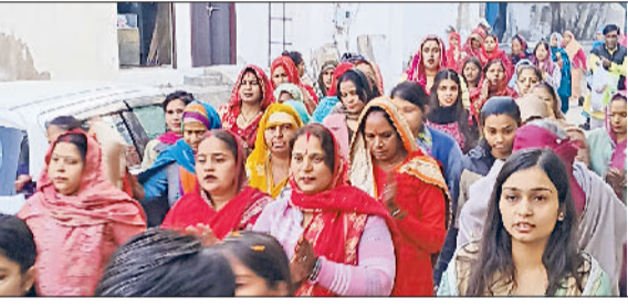
नारनौल। प्रभात फेरी में श्रद्धालु।