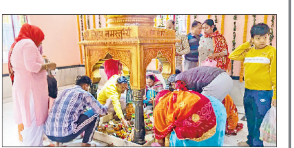
नारनौल। शिवालय पर जलाभिषेक करते श्रद्धालु।