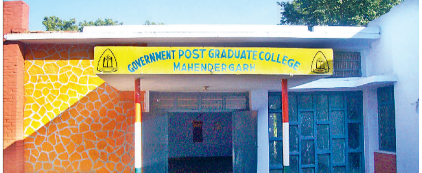
महेन्द्रगढ़। महाविद्यालय का मुख्यद्वार।