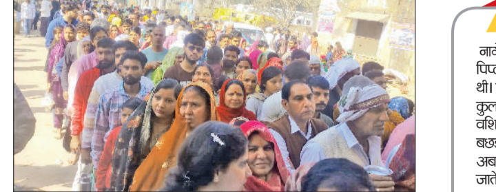
7 कनीना। बम-बम के उद्घोष के बीच कतारबद्ध खड़े शिवभक्त