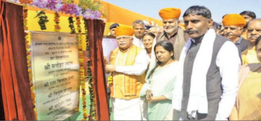
महेन्द्रगढ़। वर्ष 2019 में आईएमटी का शिलान्यास करते हुए पूर्व सीएम। फाइल फोटो

बैठक में सांसद ने लोकसभा के लिखित महत्वपूर्ण प्रोजेक्ट्स को लेकर अपनी बात रखी थी