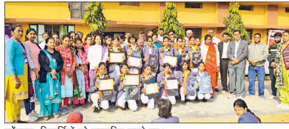
महेन्द्रगढ़। विद्यार्थियों को सम्मानित करते हुए।

प्राचार्य ने सभी प्राध्यापकों को भी निर्देशित किया गया है कि वे निर्धारित समय-सारिणी के अनुसार नियमित रूप से कक्षाएं संचालित करें तथा अनुशासन की सख्ती से पालना सुनिश्चित करें। अभिभावकों से भी आग्रह किया गया है कि वे अपने बच्चों की नियमित उपस्थिति सुनिश्चित करवाएं तथा महाविद्यालय प्रशासन के साथ सहयोग करें। इससे उन्हें अपने बच्चे के कॉलेज आने या नहीं आने की जानकारी तो प्राप्त ही हो सकेगी। साथ ही उन्हें बच्चे की अन्य गतिविधियों की भी जानकारी मिल सकेगी। वह कॉलेज आते ही तो पढ़ने में कैसे है, भविष्य को उज्ज्वल बनाने के लिए कितनी कठोर मेहनत करता है या फिर मोबाइल फोन पर रील देखने में व्यस्त है या अन्य गलत गतिविधियों में तो नहीं पड़ा हुआ है। इन सब बातों को भी अभिभावकों को जाना चाहिए। क्योंकि बच्चों के भविष्य पर ही उनका भविष्य भी टिका हुआ है। महाविद्यालय प्रशासन विद्यार्थियों के उज्ज्वल भविष्य के लिए पूर्ण प्रतिबद्ध है, परंतु इसके लिए विद्यार्थियों को अनुशासन, नियमितता एवं गंभीरता के साथ अपनी पढ़ाई में संलग्न रहना अनिवार्य होगा।