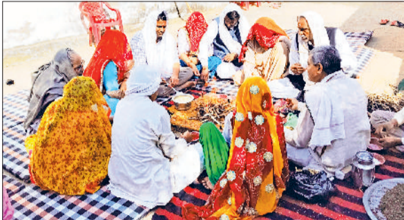
महेन्द्रगढ़। गांव बेवल में हवन यज्ञ करते हुए।

महाशिवरात्रि के अवसर पर शहर के शिव मंदिरों में श्रद्धालुओं की भारी भीड़ उमड़ी। तड़के ब्रह्म मुहूर्त से ही मंदिरों के बाहर भक्तों की लंबी कतारें लग गईं। इस दौरान 'हर-हर महादेव' और 'जय भोले' के नारों से पूरा वातावरण गूंज उठा। श्रद्धालुओं ने भगवान शिव का जलाभिषेक कर सुख-शांति और समृद्धि की कामना की। शहर के प्रमुख मोदाश्रम मंदिर, ठाकुर जी मंदिर, पंचमुखी मंदिर, श्याम मंदिर, माता संतोषी देवी मंदिर सहित के गांवों के मंदिर व अन्य शिवालयों में सुबह चार बजे से ही पूजा-अर्चना आरंभ हो गई थी। मंदिरों को फूल-मालाओं और विद्युत सजा से सजाया गया। कई स्थानों पर भजन-कीर्तन और